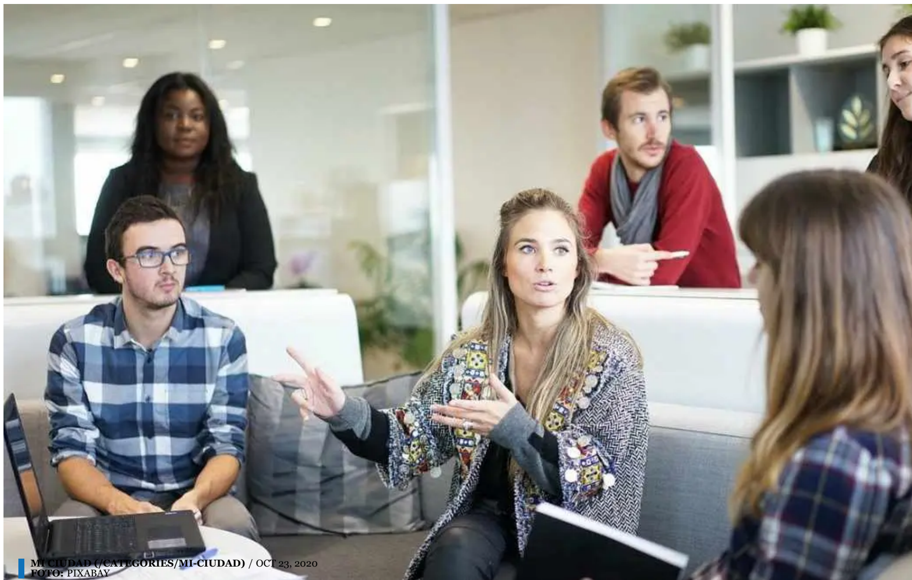
MI CIUDAD (/CATEGORIES/MI-CIUDAD) / OCT 23, 2020

( https://www.diariodemexico.com/sites/default/files/field/image/workplace-1245776_1280.jpg )